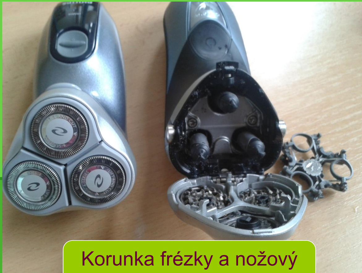
Korunka frézy a nožový věnec